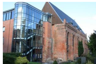
A Lasco Bibliothek